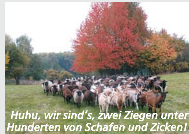
Huhu, wir sind's, zwei Ziegen unter Hunderten von Schafen und Zicken!!

Erfolge über Erfolge. Millionen Mini- oder 1-Euro-Jobber, Scheinselbständige, Freigesetzte im realexistierenden Kapitalismus können stets frei über ihr Leben, ihre Arbeit und die verbleibenden Cents entscheiden, und immer wieder aufs Neue feststellen, hören oder lesen, wie herrlich das Leben für die Gewinner in diesem trickreich geschaffenen Paradies unserer neoliberalen Wunderwelt - unbestritten - geworden ist. Die Systemveränderer haben ganze Arbeit geleistet.