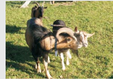
Auch Hippie hat sich wie Bella von Bock Alfons becirren lassen

Erfolge über Erfolge. Millionen Mini- oder 1-Euro-Jobber, Scheinselbständige, Freigesetzte im realexistierenden Kapitalismus können stets frei über ihr Leben, ihre Arbeit und die verbleibenden Cents entscheiden, und immer wieder aufs Neue feststellen, hören oder lesen, wie herrlich das Leben für die Gewinner in diesem trickreich geschaffenen Paradies unserer neoliberalen Wunderwelt - unbestritten - geworden ist. Die Systemveränderer haben ganze Arbeit geleistet.