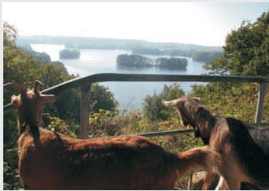
Ganz nette Aussicht auf dem Reiherberg, aber wie weit ist es noch?!?

Schöne neue Welt. So gut ging es uns noch nie, statt Brot und Spiele nun Martinitafeln und Seifenopern. Und wichtige Entscheidungen, wie 'Frei'Handelsabkommen (TTIP, CETA, etc.) werden den Bürgern abgenommen – entscheiden sollen die Experten und die Profiteure. Licht ins Dunkel der Geheimverhandlungen? Diskussionen in Parteien, Öffentlichkeit oder Medien über die gravierenden Auswirkungen?!? Wozu denn das? Die Arroganz der Macht.