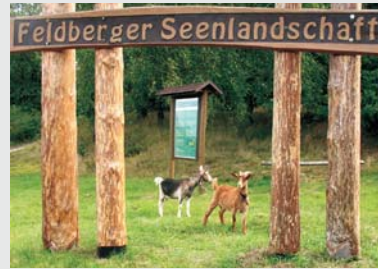
Auf dem Weg nach Hullerbusch: Ääh, wo geht es jetzt weiter?!?