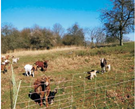
Hmm, lecker, lecker, keine Zeit 18. Woche

Die Tiere grasen auf täglich wechselnden Weiden im Naturschutzgebiet Hullerbusch, ein Bestandteil des Naturparks Feldberger Seenlandschaft, umschlossen von den Seen Schmäler Luzin und Zansen, östlich von Feldberg gelegen. Einmal die Woche geht es auf in die Schäferei und zu den Tieren, und die Frage ist, werden mich die beiden Ziegendamen mit ihrem Anhang überhaupt noch registrieren?